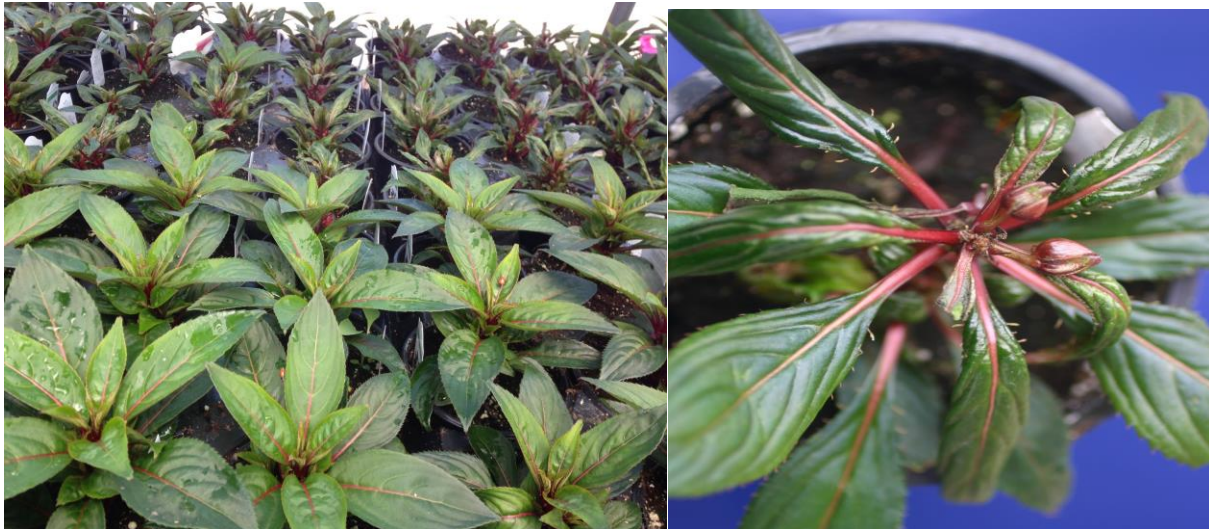
Figuras 11 y 12: Las hojas externas se doblan hacia abajo y el punto de crecimiento muere en esta Impatiens de Nueva Guinea.