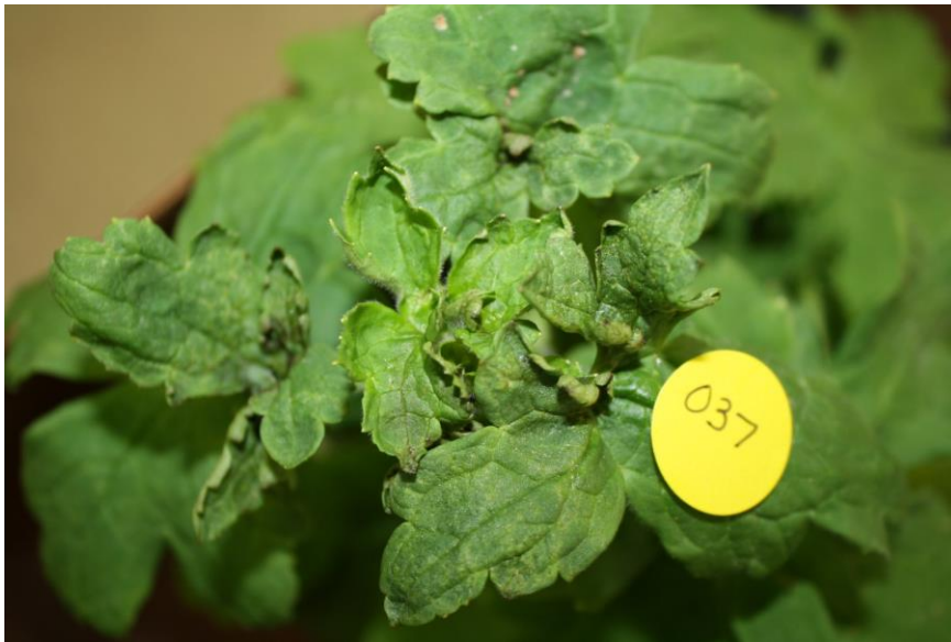
Figura 3: Daño del ácaro del ciclamen.

Los ácaros del ciclamen tienen una amplia gama de huéspedes y pueden alimentarse de violetas africanas, ciclamen, dalia, gloxinia, hiedra, boca de dragón, vinca, crisantemo, geranio, fucsia, begonia y petunia. A campo abierto, el ácaro del ciclamen puede atacar el delfinio, el acónito, el crisantemo, la verbena, la fresa y la viola. El daño al delfinio es particularmente severo, ya que la flor y los tallos se retuercen y los capullos se vuelven negros y no se abren.