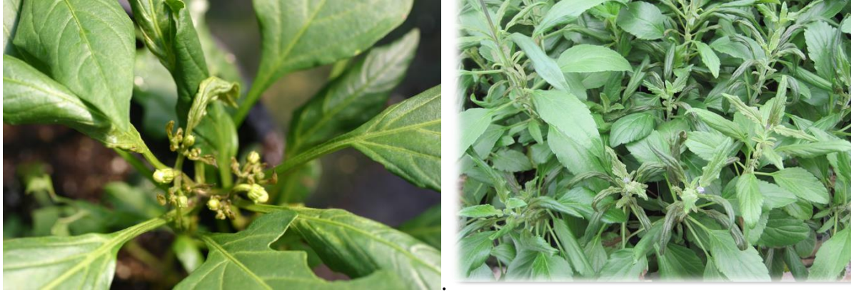
Figuras 5 & 6: Bordes exteriores de las hojas doblados hacia abajo y brotes terminales muertos en pimienta y salvia.