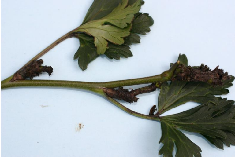
Figura 4: Lesión por ácaros del ciclamen en Aconitum. Nóte el oscurecimiento de los capullos.

Los ácaros blancos tienen una amplia gama de huéspedes y pueden alimentarse de violetas africanas, ageratum, begonia, crisantemo, ciclamen, dalia, margaritas gerberas, gloxinia, hibisco, hiedra inglesa, jazmín, impatiens, impatiens de Nueva Guinea, lantana, lysimachia, caléndula, boca de dragón, verbena, y zinnia. Los ácaros blancos también pueden infestar plantas de vegetales en camas, especialmente los pimientos. Pueden propagarse entre cultivos a través de corrientes de aire, contacto de planta a planta, por trabajadores que manejan plantas infestadas y luego tocan plantas que no están infestadas y pueden engancharse a adultos de la mosca blanca.