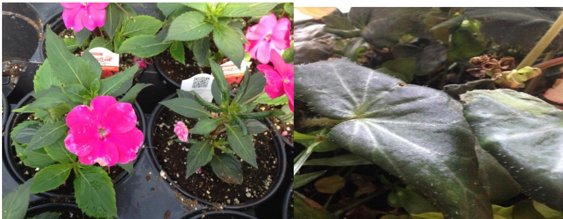
Figuras 9 y 10: Daños por alimentación en impatiens y begonias.