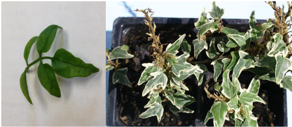
Figuras 7 y 8: Daños por alimentación en jazmín y hiedra.