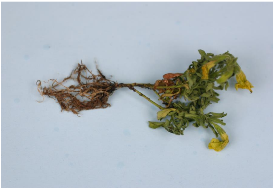
Figura 4: Thielaviopsis en raíces de calabacita lavadas. Note el oscurecimiento de las raíces y el tallo inferior.