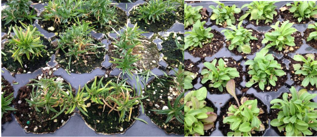
Figuras 1& 2: Las infecciones de la pudrición negra de la raíz se asemejan a un trastorno nutricional.