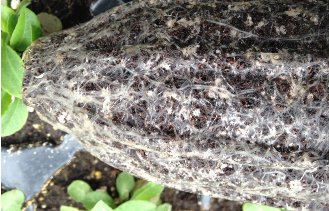
Figura 3: Las raíces están oscuras.